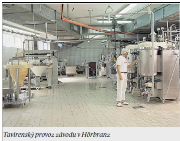
Tavný provoz závodu v Hörbranz

Dnešní společnost Rupp A. G. produkuje ročně 30.000 tun tavených a přírodních sýrů a zaměstnává na 350 pracovníků. Roční obrat představuje 105 tis. mil. EUR a 75% produkce (především tavených sýrů) putuje do více než 60 zemí světa. Největší rozvoj společnosti se datuje od roku 2008, když se na zelené louce bregenzském předměstí Hörbranz vybudoval super moderní unikátní závod s vysokým stupněm automatizace.