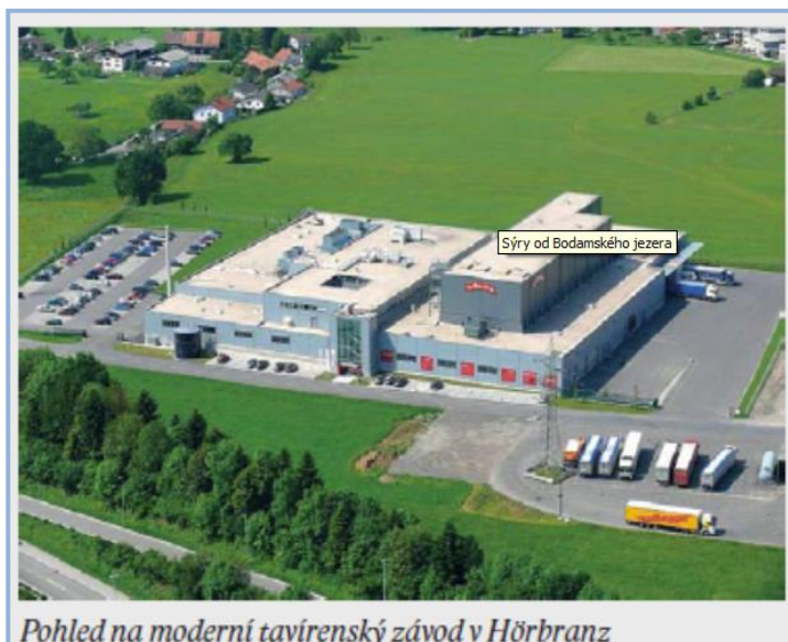
Pohled na moderní tavný závod v Hörbranz