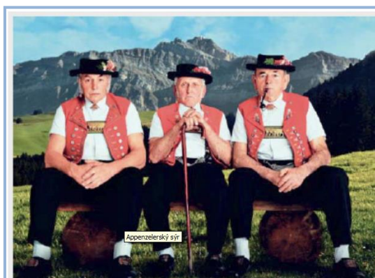
Promotéři sýra Appenzeller v tradičních místních krojích a na pozadí vrchol Säntis. Reklamy na sýr jsou zaměřené na zachování tajemství jeho výroby, které nikdo z místních obyvatel nevyzradí.

Ukázková sýrárna je poměrně moderním provozem, ale přesto ve výrobním postupu zachová všechny tradiční prvky technologie výroby sýra. Mléko do ní denně dodává nejrůznějším způsobem asi 70 sedláků z okolí a sama sýrárna vyrobí 700 tun sýra ročně. Podstatou výroby Appenzelleru je zpracování čerstvého, syrového kravského mléka. Mléko pochází od místního plemene švýcarských hnědých krav, které spásají šťavnaté alpské traviny na horských a podhorských loukách. V zimních obdobích se výlučně používá kvalitní seno, které zaručuje výslednou chuť (buket) appenzellského sýra.